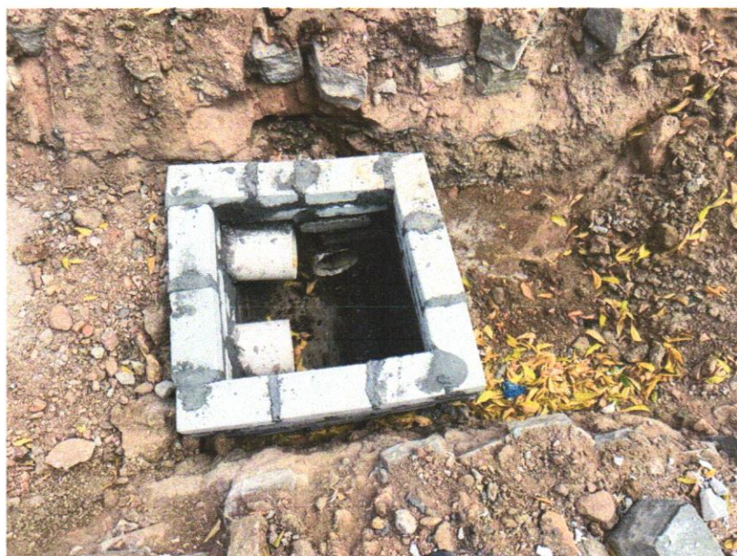
Foto 06 – ALVENARIA DE BLOCOS DE CONCRETO ESTRUTURAL 14X19X39 CM, (ESPESSURA 14 CM) FBK = 14,0 MPA, PARA PAREDES COM ÁREA LÍQUIDA MENOR QUE 6M 2 , SEM VÃOS, UTILIZANDO PALHETA. AF_12/2014