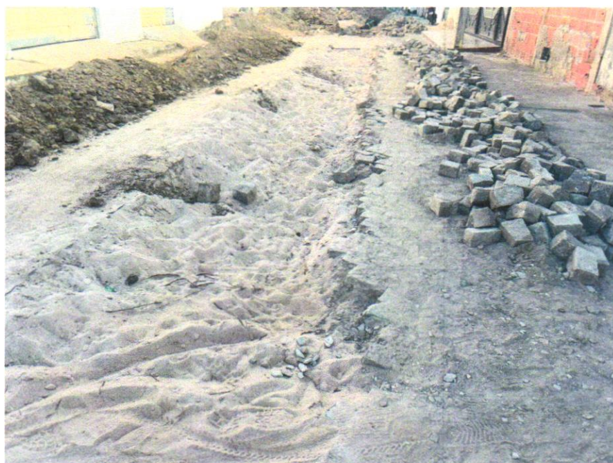
Foto 04 - ATERRO MANUAL COM SOLO ARGILO-ARENOSO IMPORTADO E COMPACTAÇÃO MECANIZADA EM CAMADAS DE 0,20 M NO MÁXIMO