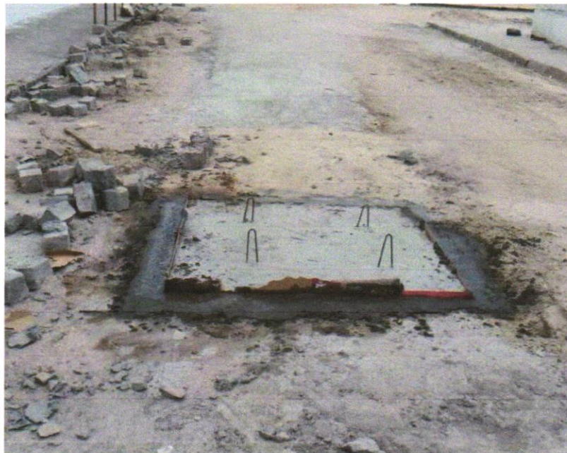
Foto 18 - CAIXAS.