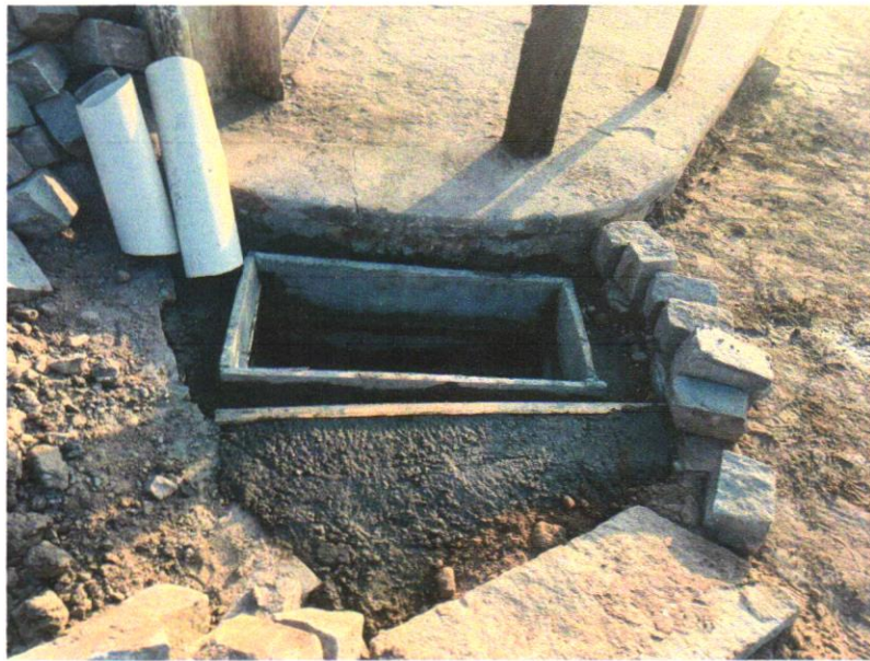
Foto 09 - CONCRETO