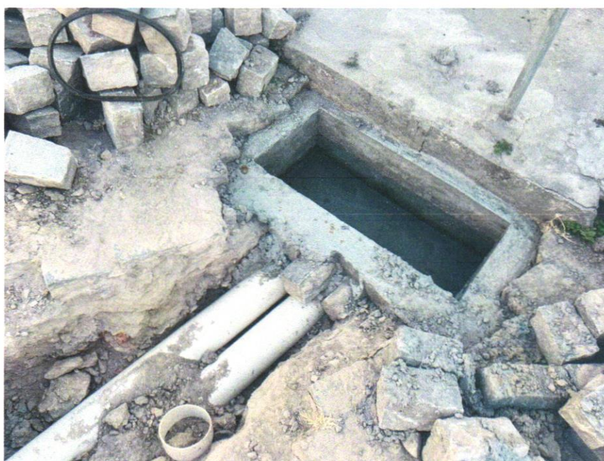
Foto 11 - TUBOS.