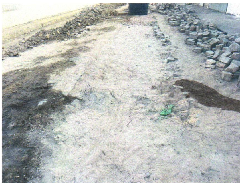
Foto 05 - ATERRO MANUAL COM SOLO ARGILLO-ARENOSO IMPORTADO E COMPACTAÇÃO MECANIZADA EM CAMADAS DE 0,20 M NO MÁXIMO