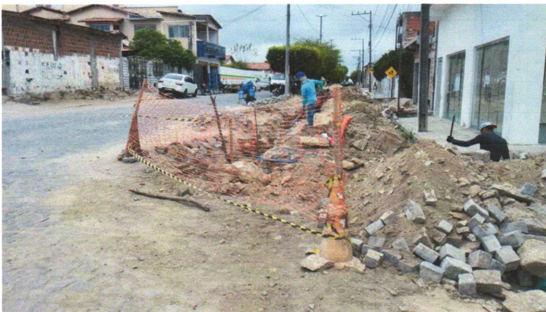
Foto 01 – Tapume de proteção em tela de polietileno h=1,20 com bloco de concreto