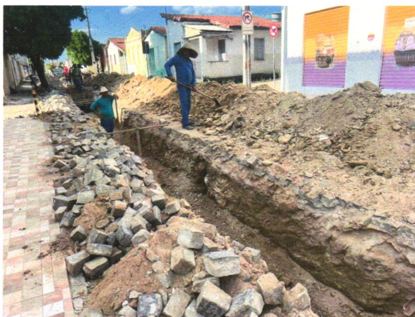
Foto 03 - ESCAVAÇÃO DE VALA