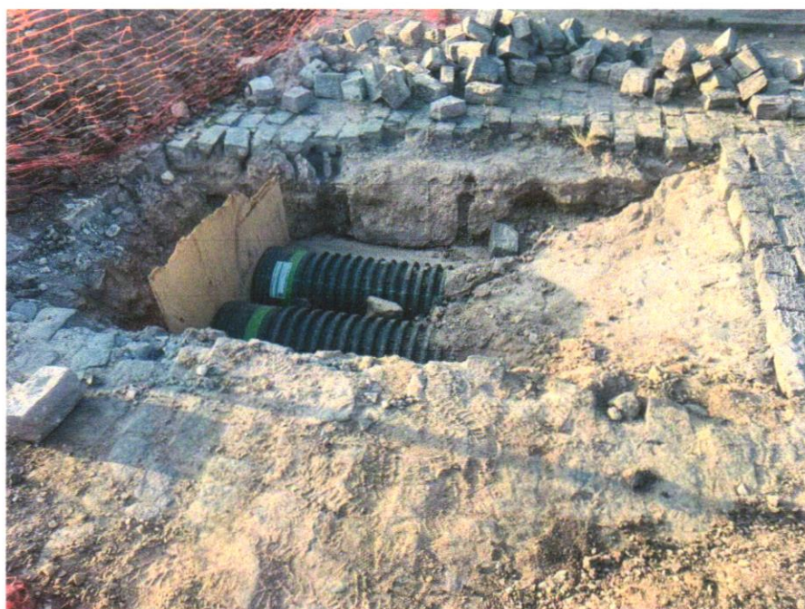
Foto 12 - TUBOS.