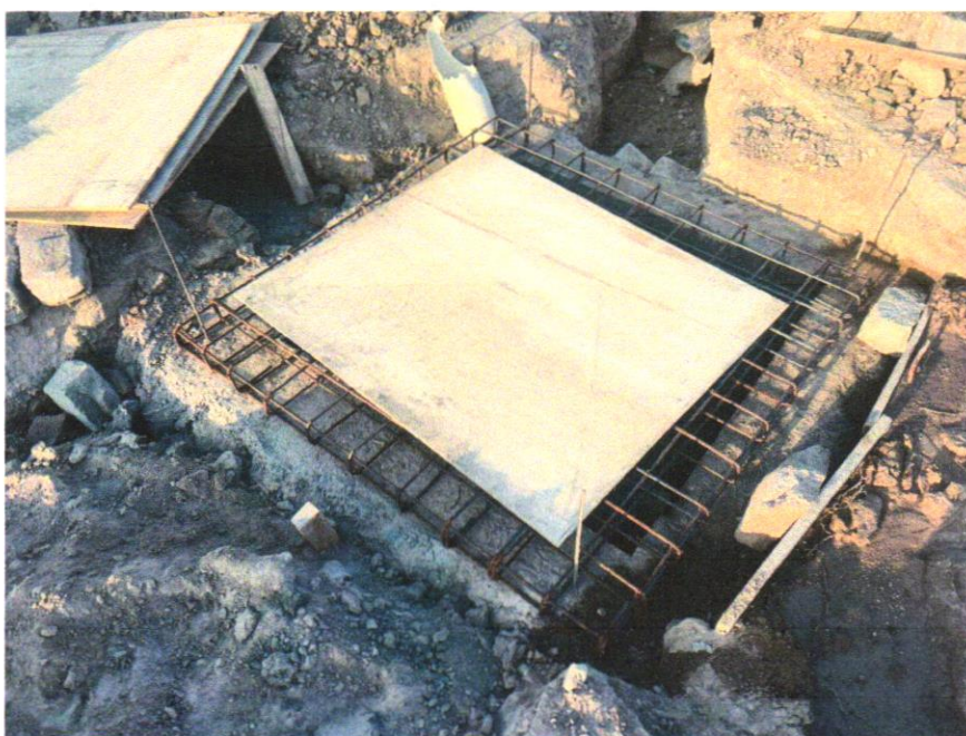
Foto 15 - CAIXAS.