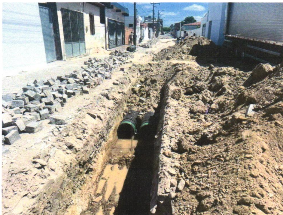
Foto 13 - TUBOS.